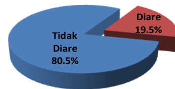
Gambar 1. Distribusi frekuensi kejadian diare pada bayi

Gambar 1 menunjukkan bahwa distribusi frekuensi kejadian diare pada wilayah kerja Puskesmas Nanggalo Kota Padang adalah 19.5%, yaitu sebanyak 16 orang dari 82 responden.