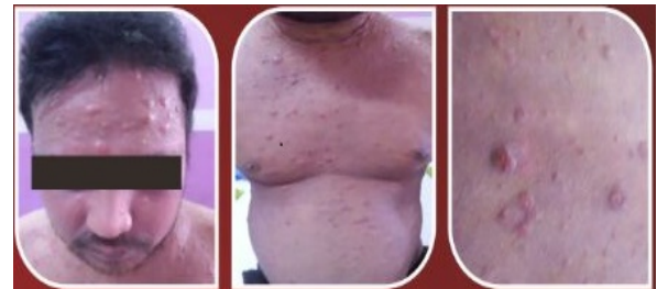
Gambar 1. Sebelum Kemoterapi

Telah dilaporkan suatu kasus laki-laki, 25 tahun dengan keluhan Benjolan pada kulit hampir seluruh tubuh sejak 4 bulan. Benjolan warna kemerahan, berkeropeng kecoklatan, kehitaman, gatal dan tidak nyeri. Awalnya muncul pada punggung sebesar biji kacang hijau sampai sebesar uang logam. Bercak-bercak merah disertai sisik warna putih yang gatal diseluruh tubuh hilang timbul sejak 2 tahun. Penurunan berat badan 15 kg sejak 1 tahun. Demam sejak 1 bulan. Pemeriksaan fisik ditemukan nodul-nodul eritem di atas kulit yang eritem dengan skuama putih kasar, erosi, ekskoriasi, multipel ulkus dengan ukuran 1-3 cm pinggir rata, isi krusta kehitaman, kekuningan dan jaringan nekrotik. Lesi terdistribusi universal bentuk dan susunan tidak khas, batas tidak tegas dan ukuran lentikular-plakat. Laboratorium terdapat leukositosis dan eosinofilia. Peningkatan IgE total >99.999,90 IU/ml dan hitung eosinofil absolut 5123 sel/mm 3 . Histopatologi kesan limfoma kutis. Pemeriksaan imunohistokimia CD3 & CD 45 positif. Pasien didiagnosis dengan limfoma kutis dengan Sindrom Hiper IgE. Diberikan kemoterapi siklofosfamid, vinkristin dan prednison, serta immunosupresan, emolien dan steroid topikal, dengan respon yang baik.