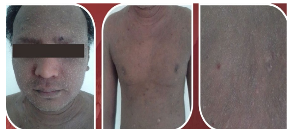
Gambar 2. Setelah Kemoterapi