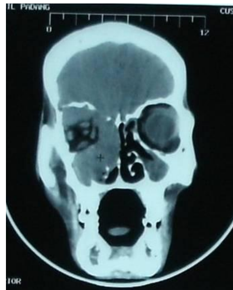
Gambar 3. CT Scan potongan koronal

Pada pemeriksaan CT scan orbita didapatkan hasil dengan kesan tumor (ganas) sinus maksilaris dekstra dengan perluasan dan infiltrasi ke intrakranial. (gambar 3). Pada röntgen toraks postero anterior didapatkan kesan metastase ( lympoid type ) (gambar 4).