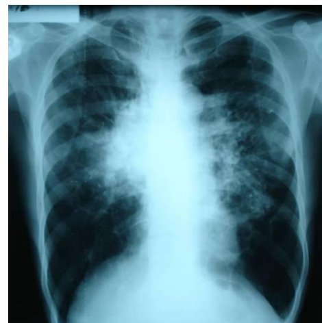
Gambar 4. Rontgen toraks PA

Saat itu ditegakkan diagnosis kerja tumor sinus paranasal dekstra dengan perluasan intrakranial dan metastasis ke paru, direncanakan untuk dilakukan biopsi.