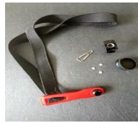
Gambar 1. TLD chip, holder 'eye-D' TLD lensa mata, dan holder TLD cincin

dengan D adalah dosis radiasi, bacaan TLD adalah hasil bacaan TLD dalam satuan nC, dan FK adalah faktor kalibrasi individual masing-masing TLD yang telah ditentukan sebelumnya dan diberikan dalam satuan mGy/nC.